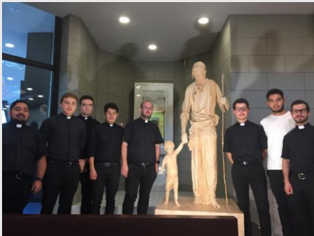
Seminario de Macerata: San José